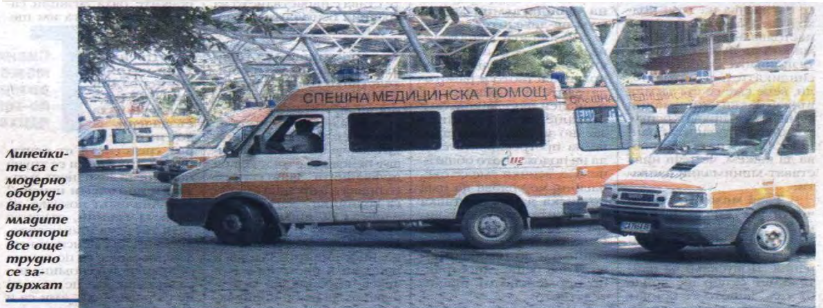
Линейките са с модерно оборудване, но младите доктори все още трудно се задържат

Освен трафика и липсата на специална лента за линейки, шофьорите се оплакват, че трудно намират адресите заради липсата на номера по блоковете. Всяка седмица харча по 6-7 лв. за боя и четка. С тях рисувам номерата, където отидем, да ни е лесно следващия път, сподели шофьор от Варна. Той и неговите колеги са на мнение, че в това отношение общините трябва да си свършат работата. Пациент се обади на 112 от външен телефон и записал блок в кв. "Владислав Варненчик" с 24 входа, но не посочил входа и апартамента. Изминахме 13 км за 8 минути, но след това загубихме време да търсим болния, сподели шофьор. Чува се гласове, че и не всички GPS-и на реанимобилите работят, а те са неоеценим помощник в райони с по-объркана регулация.