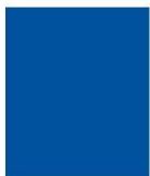
PMS Reflex Blue